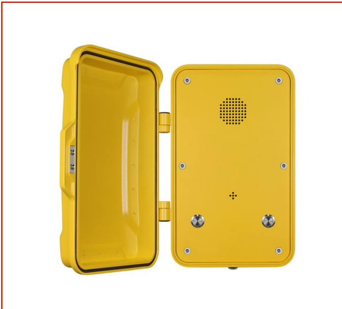
Teléfono resistente a la intemperie

Modelo: JR102-2B : Ideal para Metro, Ferrocarril, Carretera, Marina, Minería, Túneles, Planta de Acero, Planta Química, Planta de energía y aplicaciones industriales relacionadas, etc.